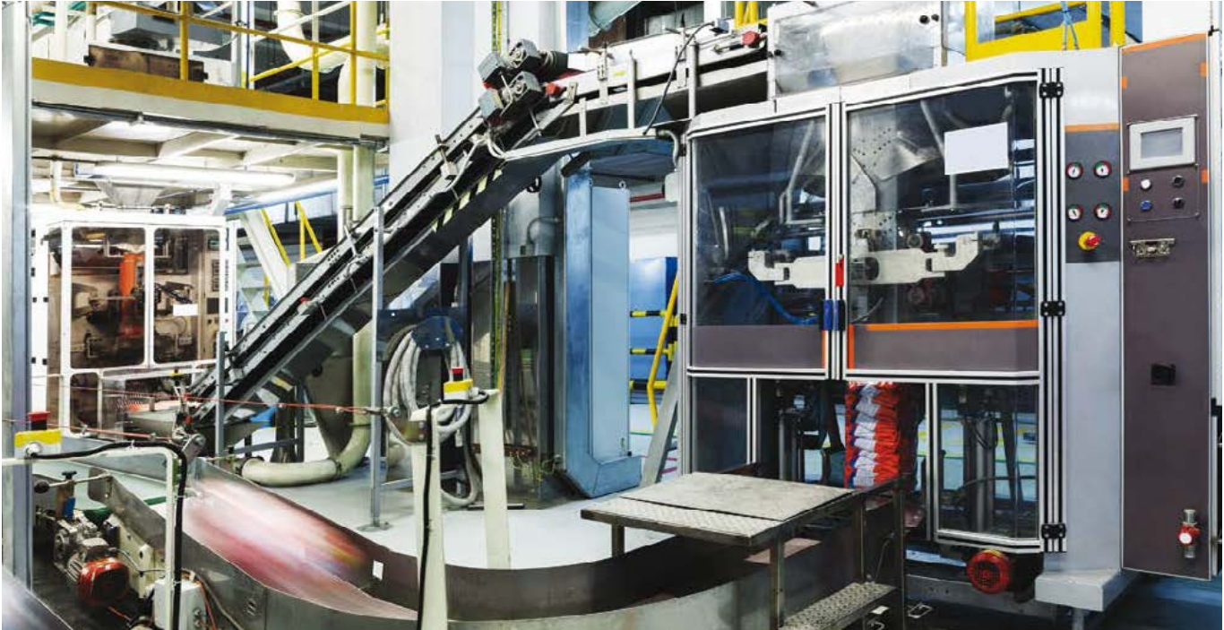
Optimierte Produkte für eine höhere Produktivität bei geringerem Engineering-Aufwand