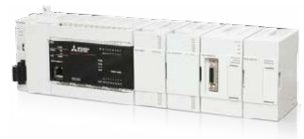
Den Anforderungen entsprechend können diverse Module hinzugefügt werden.

Die aktuelle Position des Werkstückes erhält man durch die Druckmarkenerkennung, die auf einem sich schnell bewegenden Folienstreifen aufgedruckt sind. Basierend auf diesen Positionsmarken, ergibt sich durch die Kompensation der Schneidachsenposition eine optimierte Schneidposition.